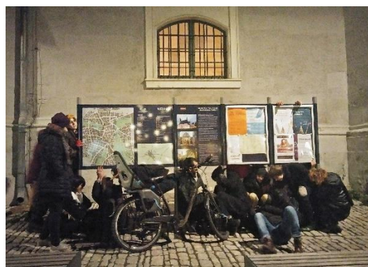
Bauhaus Students - Bodies in Urban Spaces