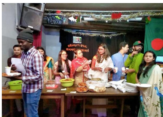
每周的 Culture Talk 會邀請各地的同學介紹自己的國家與文化

大家若想取得更多德國的訊息，可以加入臉書社團，如德國台灣同學會、威瑪幫 Deutsches Reich Weimarer Republik……等等。