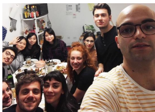
與義大利的朋友們分享傳統美食