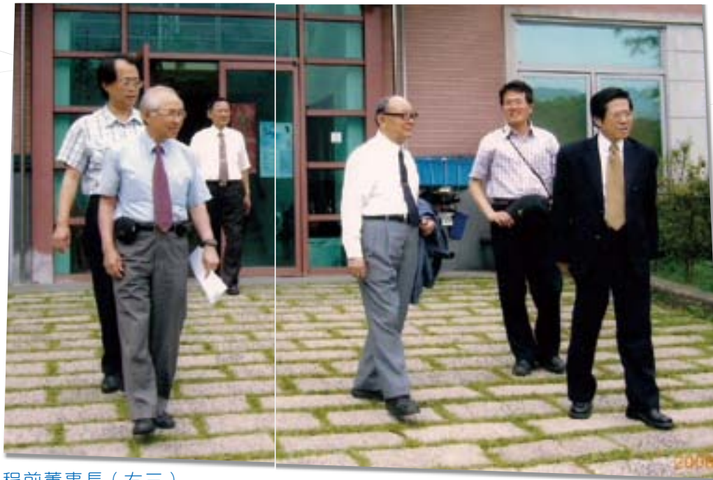
程前董事長（右三） 參訪翡翠水庫管理局

中興社於國內創業穩固後，於民國 62 年起開始拓展國外工程顧問業務。首先以東南亞國家為目標，因該等國家建設計畫經費大都向亞洲開發銀行、世界銀行或日本國際協力機構等貸款興建，故工程顧問招標均需以在上述銀行機構登記合格之工程顧問機構為對象。中興社憑藉專業與經驗，順利標得在越南、菲律賓及印尼多項水利、電力、自來水等工程顧問計畫，亦建立良好聲譽。其後因擴展需要，在印尼雅加達設立中興社駐印尼辦事處（後升為印尼分社），從此，我國從工程技術輸入國轉變為技術輸出國，並自民國 67 年起即列名美國「工程報導」雜誌前二百大國際工程顧問排行榜，中興社自此成為國際間知名工程顧問公司，達成政府當初推動設立工程顧問機構所定之要旨。